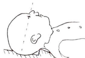
Figure 2 Position de la tête et du cou, La jonction entre le cou et le crâne touche l'angle de la mousse